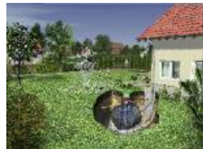
A - Schéma d'installation kit jardin Carat Jet