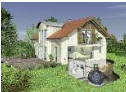
B - Schéma kit jardin relais Carat Eco Plus