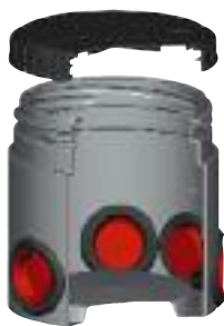
A - boîte de répartition 3 sorties [*** SR103P ***]