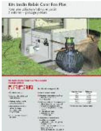
B - Schéma kit jardin relais Carat Eco Plus