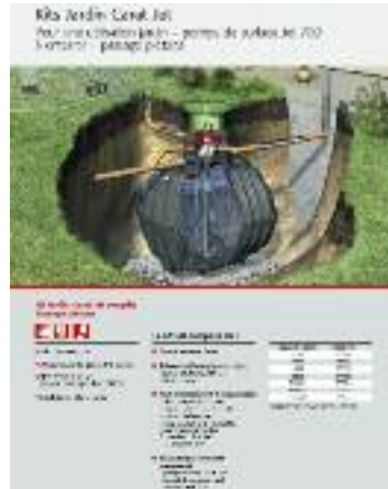
A - Schéma d'installation kit jardin Carat Jet