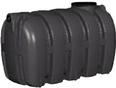
A - fosse FAN