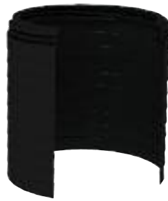
A - rehausse fosse PE 20cm