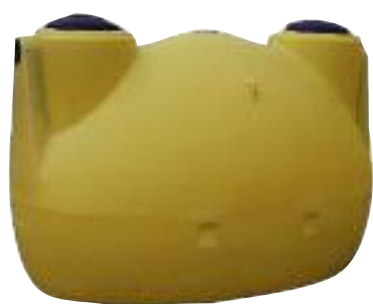
fosse PE Sebico