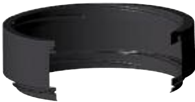
A - rehausse fosse FAN